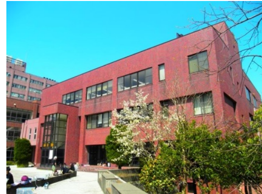
↑(上越教育大学附属図書館外観)

OPAC( http://libopac.lib.juen.ac.jp/opac/ )で探せます。各階に備え付けのノートパソコンがありますので、ご利用ください。