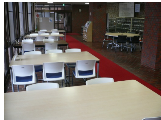
↑(1階ライブラリーホール)

情報交流ゾーンに緑の1人掛けソファが2脚あります。 勉強で疲れた頭をリフレッシュするために使ってみてはいかがでしょうか。(下城)