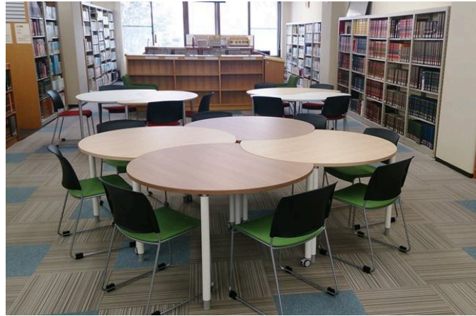
↑(2階情報交流ゾーン)

2階、参考図書コーナーの一部が、情報交流ゾーンとして生まれ変わりました。可動式テーブルや椅子も入り、資料を広げて、ゆったりと閲覧したり、ホワイトボードもありますので、資料を使いながら、グループでの学習(話し合いや作業等)にもご利用いただけます。どうぞご利用ください。