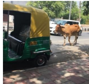
路上に牛がいても何も驚かなくなった筆者

また、日本人は同意を示すとき頷きますが、インド人は首を横に傾げます。最初は戸惑いですが、最近私にも返事が面倒臭いとき首を傾げるようになりました。