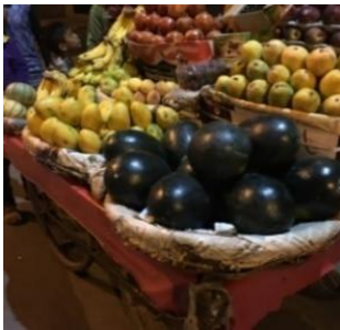
筆者行きつけの屋台にて

日本食が恋しくなるかについては、今「大地のぶた」と「上越家」に行きたいです。固め濃いめで。