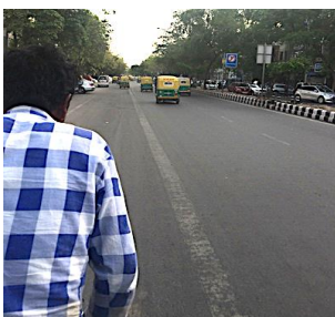
リキシャに乗る筆者

野良「牛」がいます。牛が道路で寝て、渋滞するのは日常茶飯事。その他、野良犬（大量）、物乞い、屋台、ゴミ山など見かけます。自転車タクシー（リキシャ）を拾うことも。